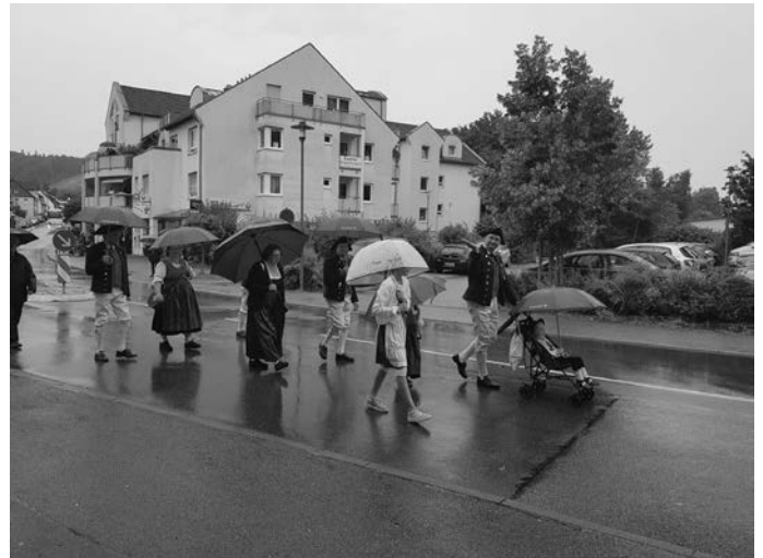
Garbenwagen in Gschwend August 2021

wieder über die Tanzfläche führen dürfen und den Herren beibringen dürfen wie man ein Madl richtig über die Tanzfläche führt. Also AB IN DIE TANZSCHUHE und einfach kommen.